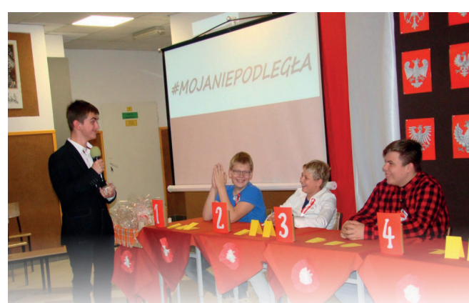
Szkolny Konkurs Wiedzy Historycznej